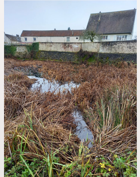
la mare en hiver