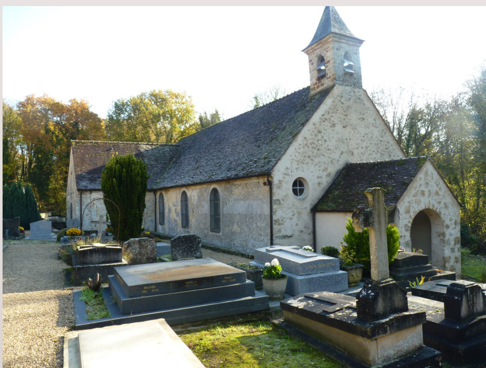
Église Saint-Gilles, également nommée Saint-Ferréol

En cas d'archives scannées, veuillez, si cela est possible, à une haute définition des images en format png ou jpg.