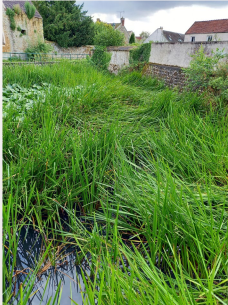
la mare en été

Nous espérons faire les travaux cet hiver pour retrouver la mare que nous connaissions avant cette invasion.